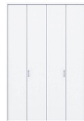
天井ジャスト吊り付 F-FT W=6尺 パールホワイト色 XOFA5TE-PW ※イメージ画像