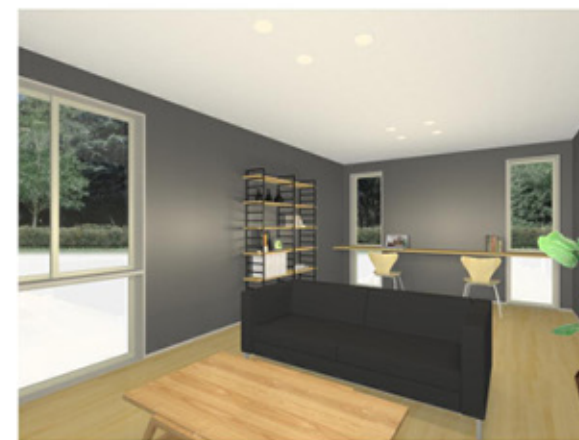
<ROOM B> イメージ