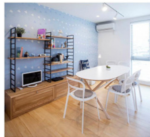
<ROOM A> ・無垢の木の収納(オプション)