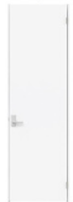
天井ジャスト7 F-XF パールホワイト色 CDFAVXF-P-PW ※イメージ画像