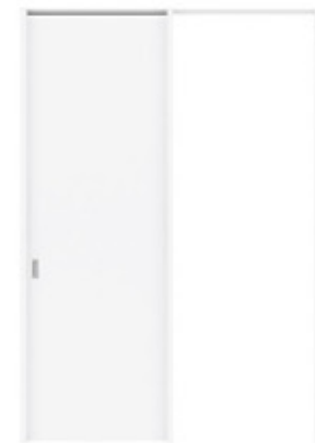
天井ジャスト上吊り吊り付引き戸 F-XF パールホワイト色 PTFA4XF-B-PW ※イメージ画像