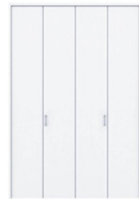
天井ジャストローゼット F-FT W=6尺 パールホワイト色 XOFA5TE-PW ※イメージ画像